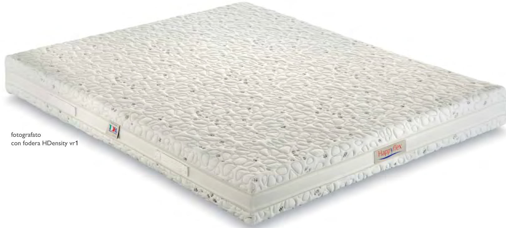
fotografato con fodera HDensity vr1