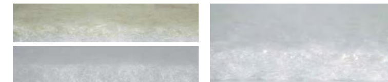
CLIMATIZZATA: Pura Lana / Cotone ANALLERGICA: Fibra Poliesteri