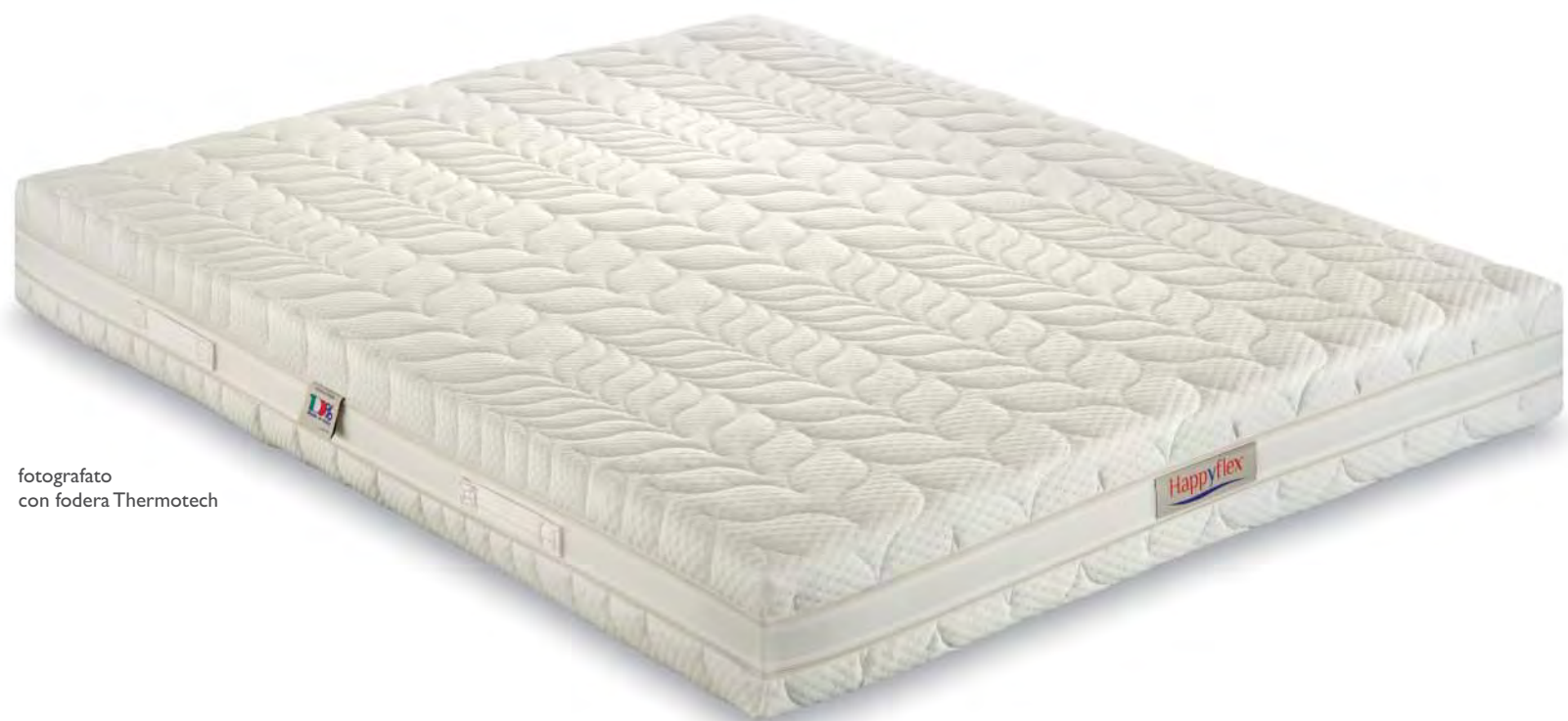
fotografato con fodera Thermotech