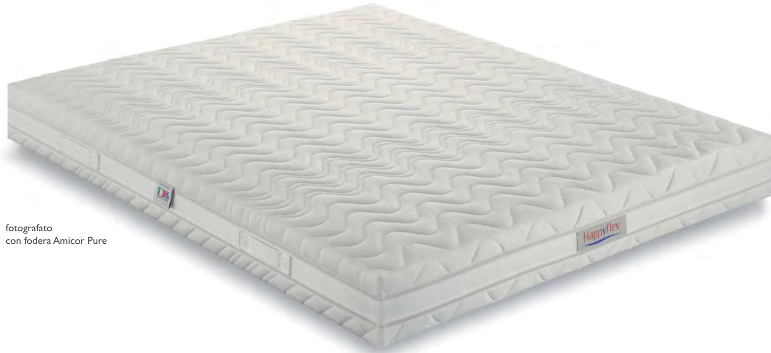
fotografato con fodera Amicor Pure