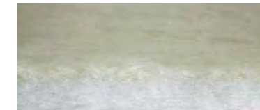
CLIMATIZZATA: Pura Lana