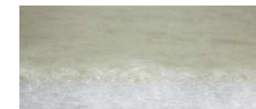
CLIMATIZZATA: Pura Lana