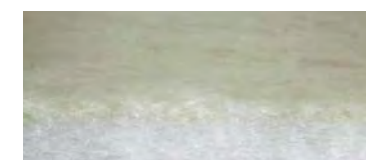
CLIMATIZZATA: Pura Lana