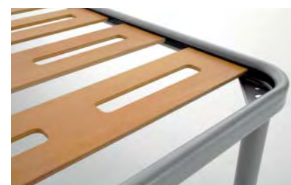
sistema incasso listelli su tubolare scanalato