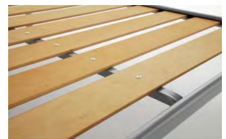
supporto centrale antiaffossamento