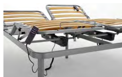
sistema di regolazione elettrico con doppio motore