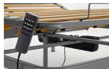
sistema di regolazione elettrico con un solo motore