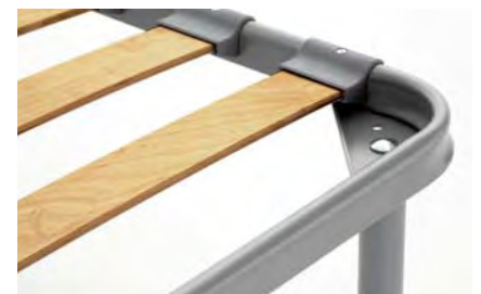
sistema fissaggio laterale con supporti porta-doga a manina