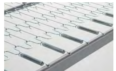
sistema di aggancio molle nella zona testa e piedi