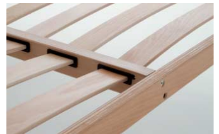
traversa centrale superiore antiaffossamento con speciali innesti porta-doga