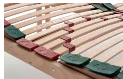
regolatori dorsali di rigidità area lombare